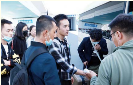
登车前逐一测量体温并做记录