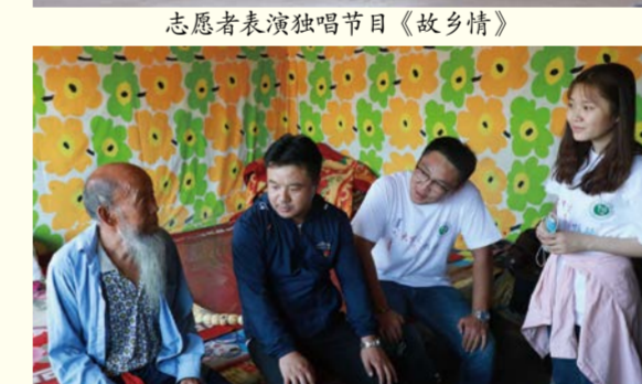
志愿者看望空巢老人