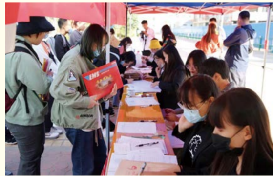
各专业报到登记现场