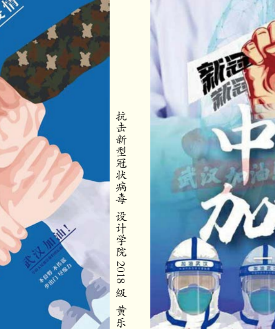
抗击新型冠状病毒 设计学院2018级 黄乐