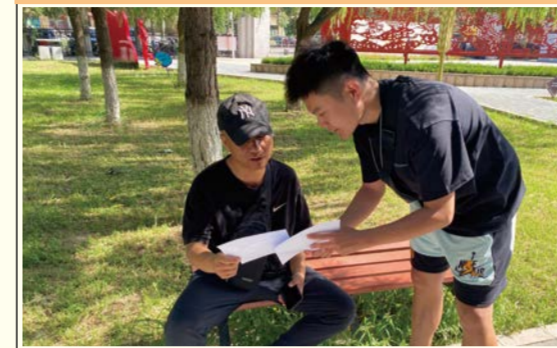
文管学院普法宣传团走进包头市党建公园开展普法宣传

志愿者们通过多种形式的展演、调研及志愿服务活动，以实际行动汇聚青春力量、助力脱贫攻坚，在实践中认识新时代、拥抱新时代、耕耘新时代，将爱国情、强国志、报国行自觉融入新时代追梦征程，为决胜全面建成小康社会，夺取新时代中国特色社会主义伟大胜利，实现中华民族伟大复兴的中国梦汇聚起了积极的青春力量。