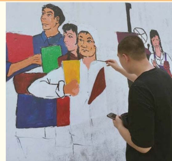
美术学院志愿者在南桥沟村进行墙绘创作