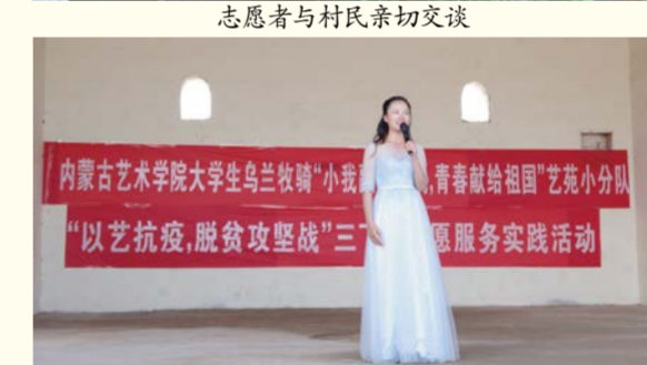
志愿者表演独唱节目《故乡情》