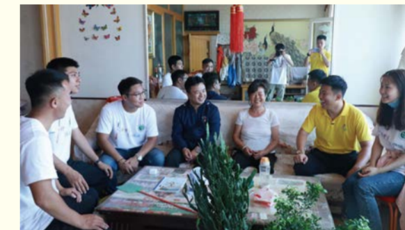
志愿者与村民亲切交谈