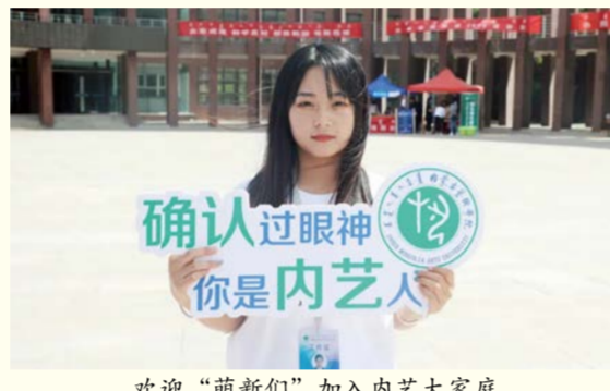
欢迎“萌新们”加入内艺大家庭