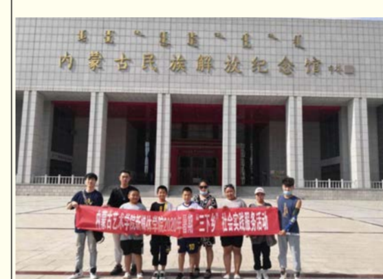
新媒体学院志愿者参观内蒙古民族解放纪念馆并在参观群众中开展有关宣传活动