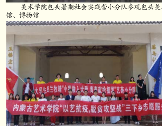
志愿者演出后合影留念