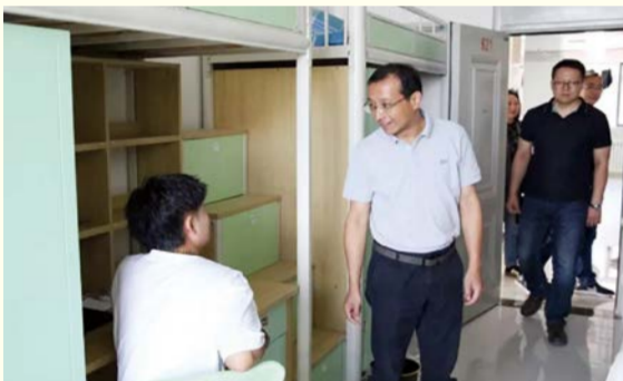
校领导来到南校区新生宿舍与学生亲切交谈