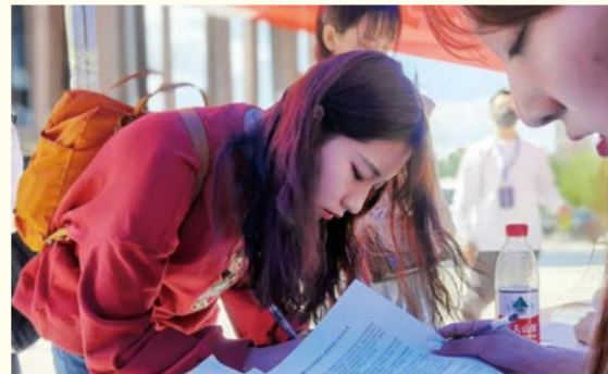
新生按照要求认真填写相关信息