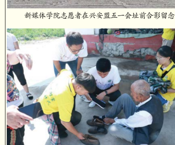
志愿者为空巢老人捐赠衣物