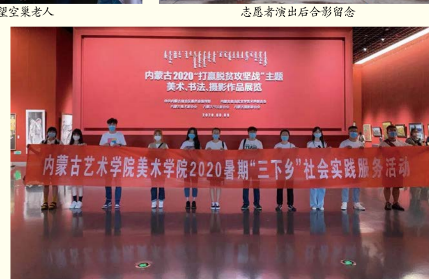
美术学院2020暑期“三下乡”社会实践活动合影