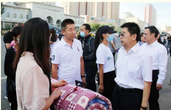
校领导与新生及家长亲切交谈