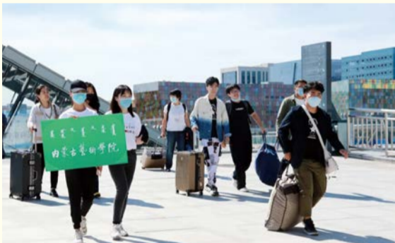
学校工作人员赴呼和浩特市火车站迎接新生