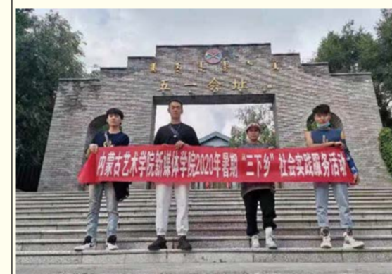
新媒体学院志愿者在兴安盟五一会址合影留念