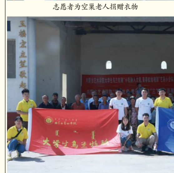
志愿者和父老乡亲合影留念