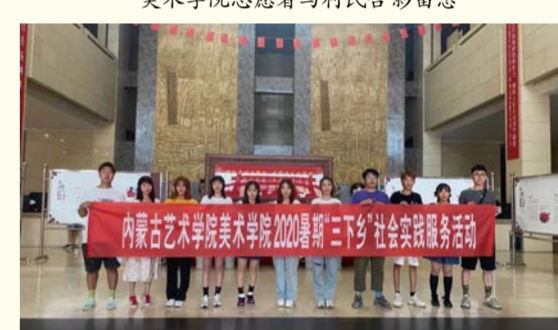
美术学院包头暑期社会实践小分队参观包头美术馆、博物馆