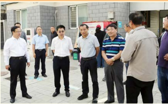
校领导来到新生宿舍区进行检查