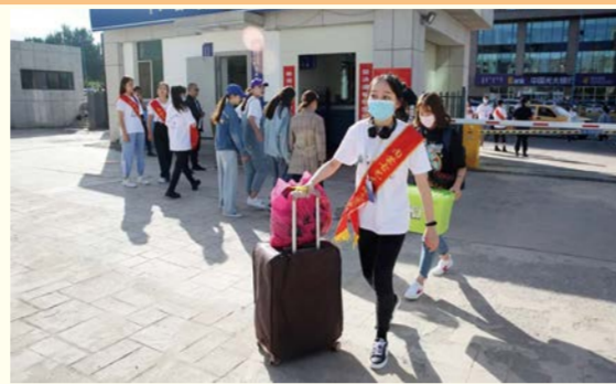
北校区校园里，学生志愿者为新生引路