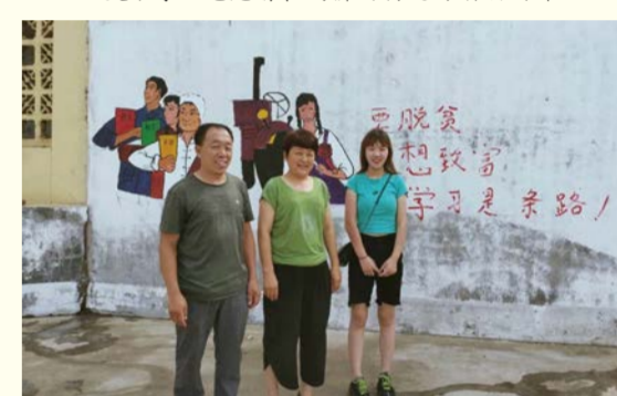
美术学院志愿者与村民合影留念