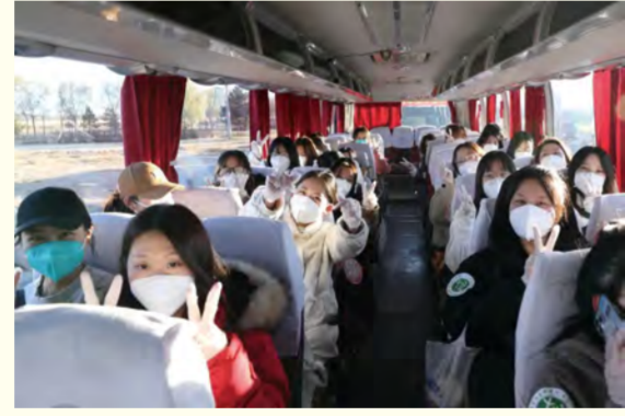
返乡学生有序离校