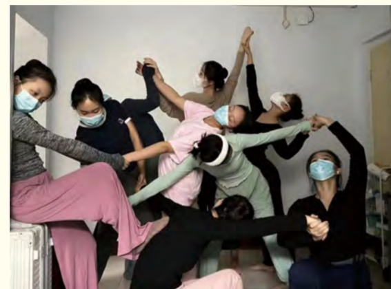
舞蹈学院学生即兴创作