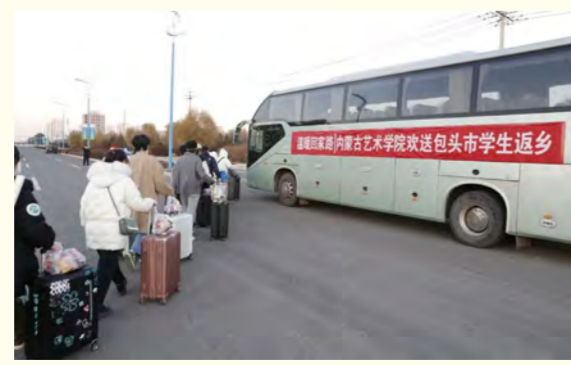
我校送包头学生返乡