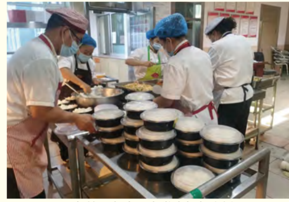
餐饮服务中心为学生打包盒饭