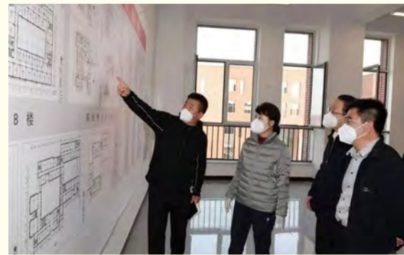
自治区党委副书记、自治区政府主席王莉霞到云谷校区指导工作。右一为校党委书记刘前贵，左一为校党委副书记赵晓强

10月8日夜间，呼和浩特特地区受强冷空气影响，气温骤降，断崖式降温让许多没有带足御寒衣物的学生猝不及防，在了解情况后，校领导亲自部