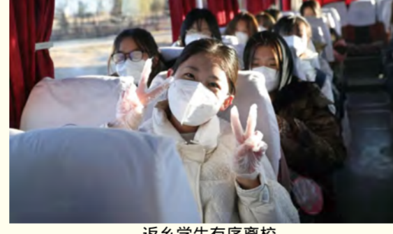
返乡学生有序离校