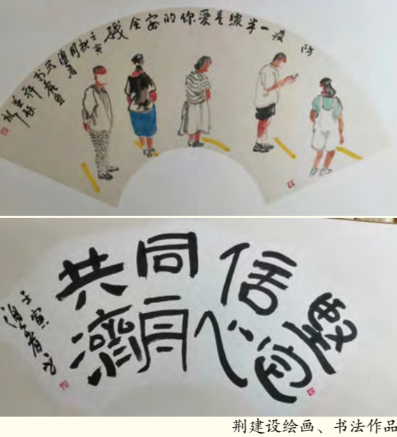
荆建设绘画、书法作品