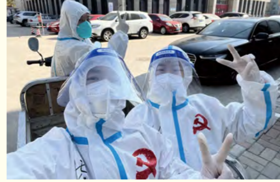
奋战在抗疫一线的老师